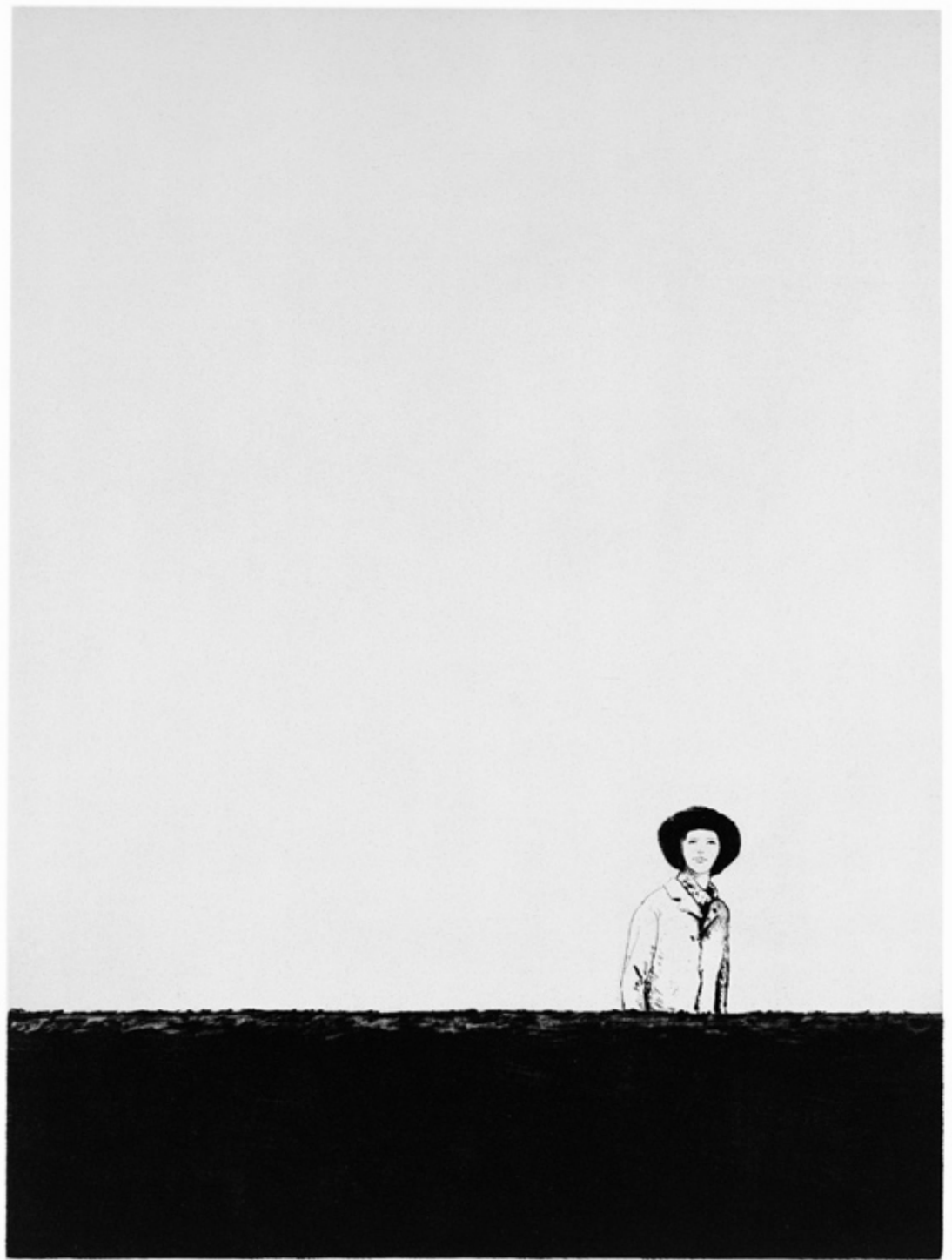
o.T. (Frau), 40 x 30 cm, Kaltnadelradierung auf Hahnemühle Bütten (gebl.-weiß), 2005