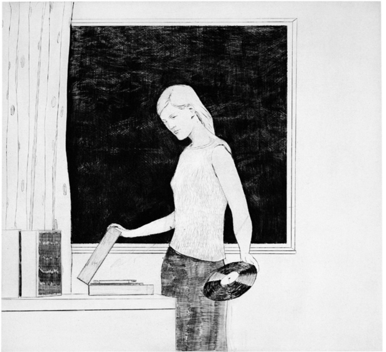
„Musik“, 55 x 60 cm, Kaltnadelradierung auf Hahnemühle Bütten (gebl.-weiß), 2005